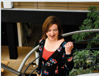
TOEZICHTHOUDEN MET IMPACT