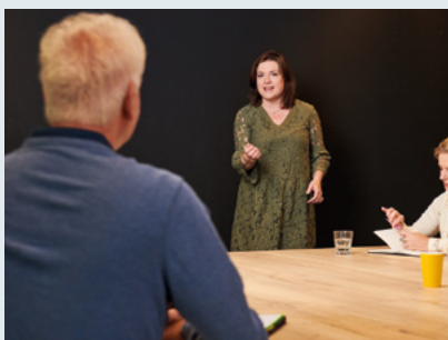
EVALUATIE RADEN VAN TOEZICHT