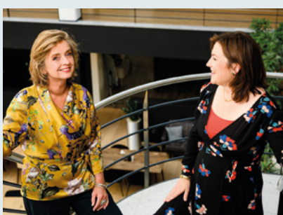
ETHIEK VAN HET MANAGEMENT